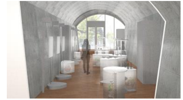
展示空間イメージ

建築家 永山祐子氏設計の展示空間に生まれ変わります。自由曲線で描かれた小石のような平面形状の展示什器が、高さのバリエーションを持ちながら複数台置かれることで、作品展示空間にリズムを生み出します。